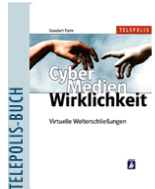
CyberMedienWirklichkeit - Virtuelle Welterschließungen. Von Goedart Palm

Hausgemachte Gammastrahlung in der Erdatmosphäre